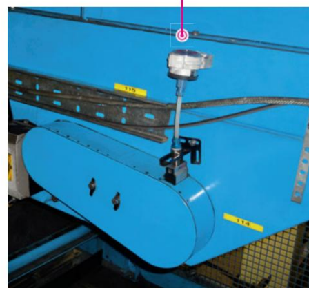
A esteira transportadora de bagagem em um aeroporto é lubrificada automaticamente a partir do exterior, o que significa que não há necessidade da demorada remoção da tampa da corrente.