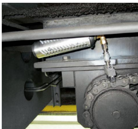
O lubrificador simalube de 250ml lubrifica o acionamento por corrente de um guindaste ferroviário. O dispensador também é protegido por uma capa protetora.

«Economize tempo e melhore a confiabilidade com a lubrificação de corrente simalube»