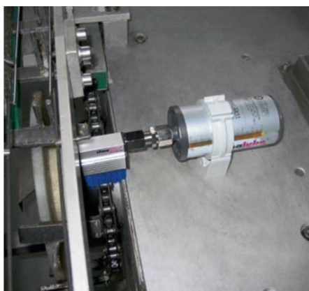
Na indústria alimentícia, a escova azul especial é usada com óleo alimentar.